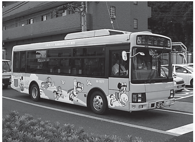
JR登戸駅と施設をつなぐ川崎市バス藤子・F・不二雄ミュージアム線「バーマン号」